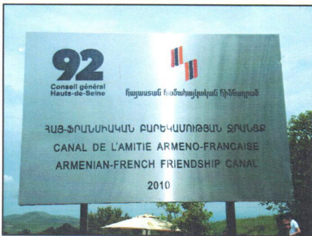
Le Président du Conseil général a inauguré le canal le 22 mai 2010.

=> extension des surfaces cultivables de près de 700 ha